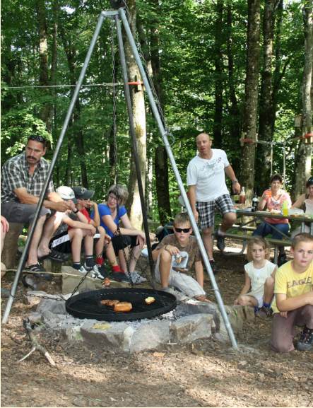
Erlebnis- & Grillplatz Balmli