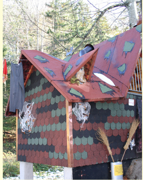
Hexenhaus Waldspielplatz St.Karl